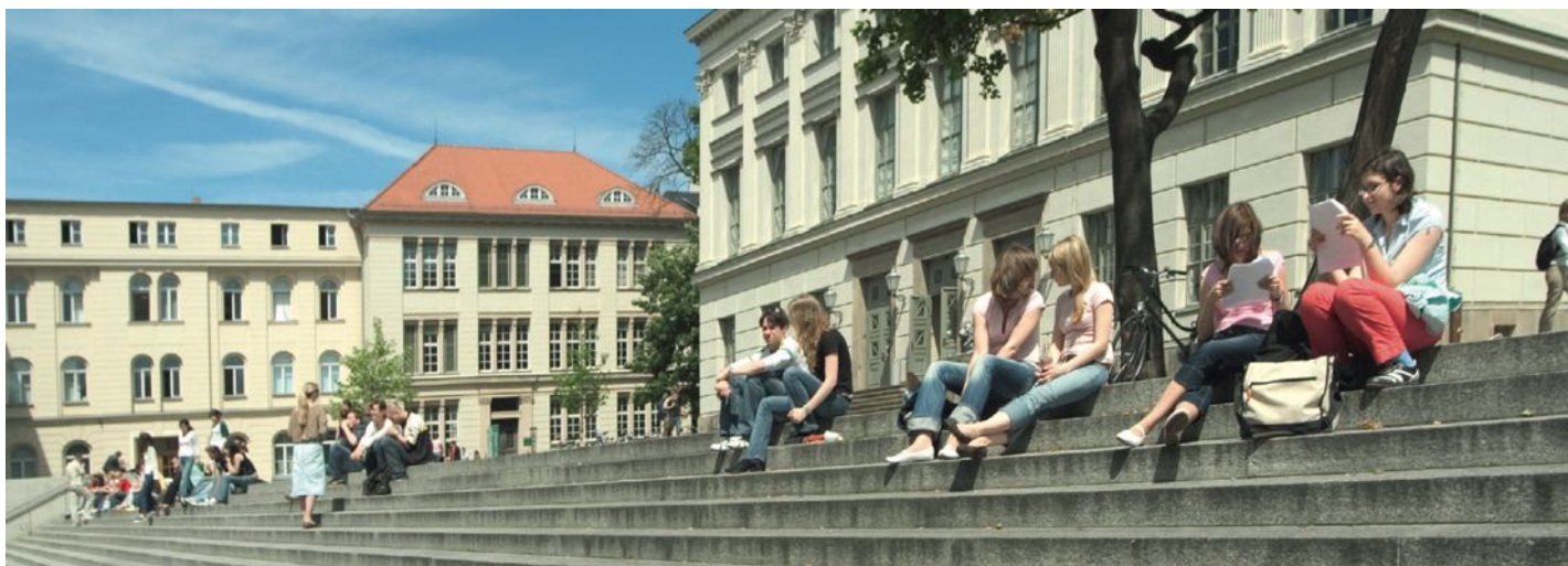
UNIwersytet MARTINA LUTRA W HALLE-WITTENBERDZE

W czasie trwania szkolenia otrzymuje się wynagrodzenie od firmy szkoleniowej.